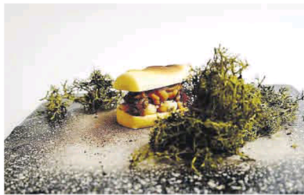
La 'Pulguita de Otoño', tapa ganadora de este año.