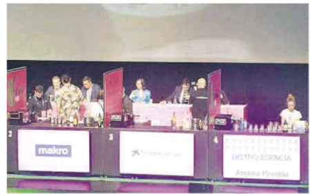
Tres participantes preparan sus elaboraciones.

tapa Xocolata amb Xurros , y otro a la mejor tapa elaborada con Oli de Mallorca, que recayó en el restaurante Maleva por su tapa Terra .