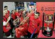
Un aficionado se fotografía junto al trofeo.

► El trofeo conquistado en Eliche se exhibe ante centenares de hinchas