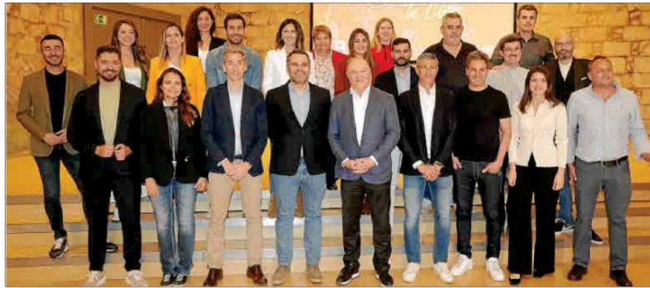
Imagen general de la presentación de la programación de IB3 en Es Baluard con motivo de la Copa del Rey.