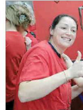
Dos aficionadas junto a la Copa del Rey ganada al Elche.