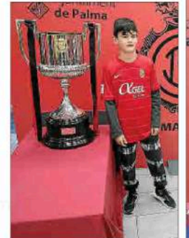
Un joven aficionado, junto al trofeo del año 2003.