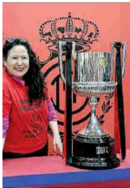
Una seguidora posa en el Mercat con la Copa que se ganó en Elche.